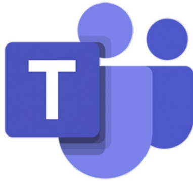
Kollaborationsplattform MS Teams